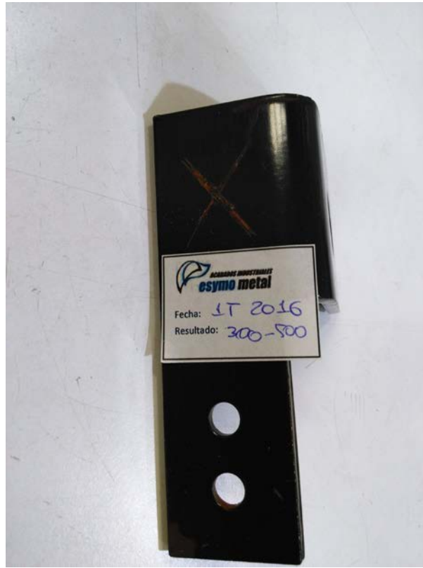
Pintura en Polvo 300 - 500 h