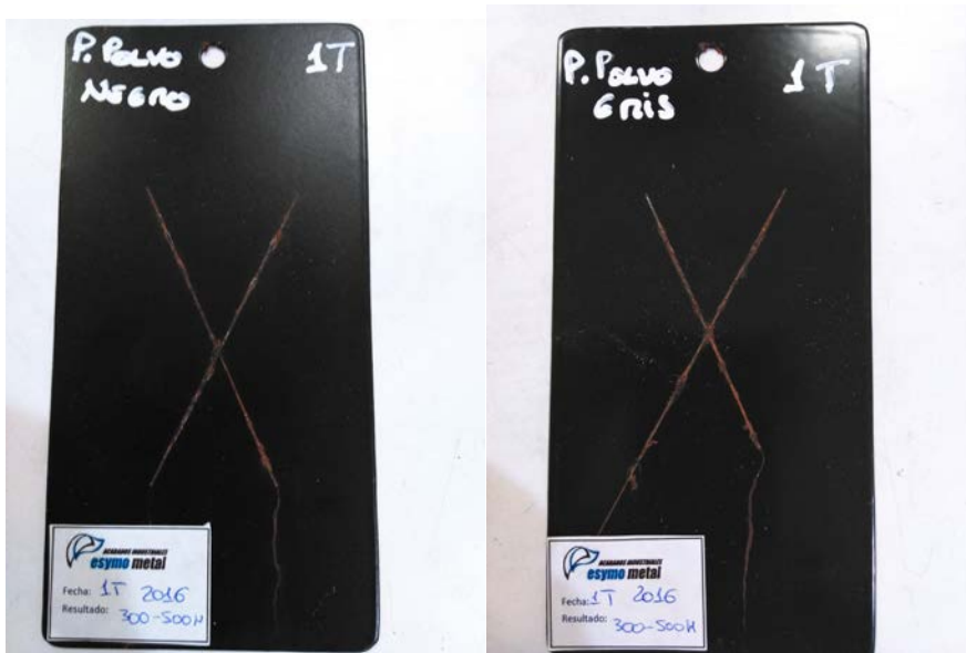
Pintura en Polvo 300 - 500 h