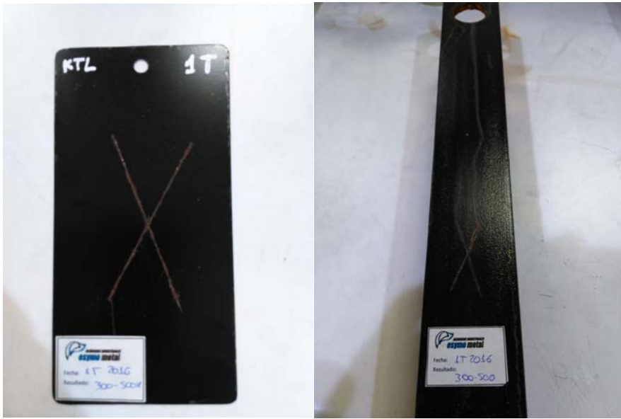
Cataforesis 300 - 500 h